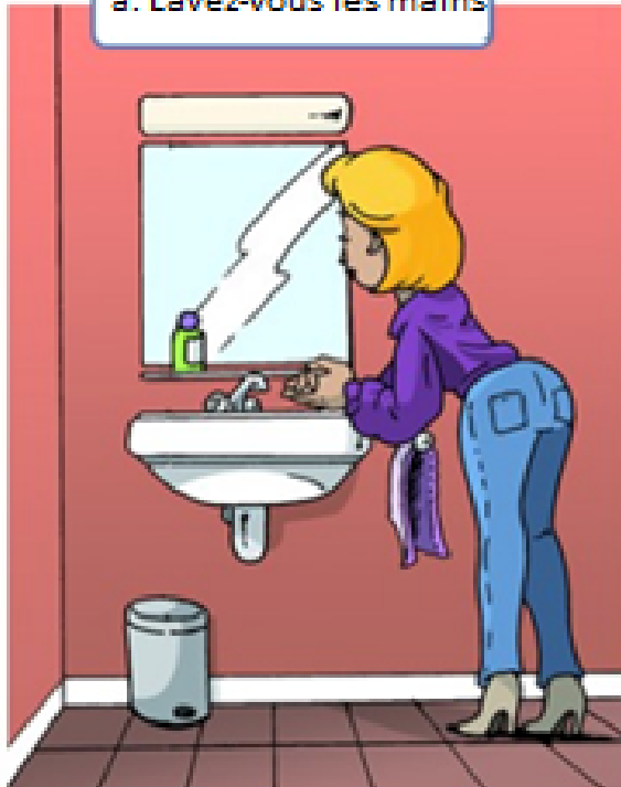
a. Lavez-vous les mains